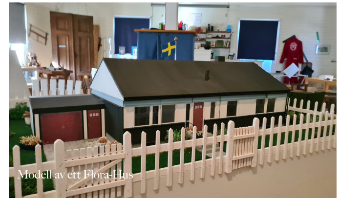
Modell av ett Flora-Hus