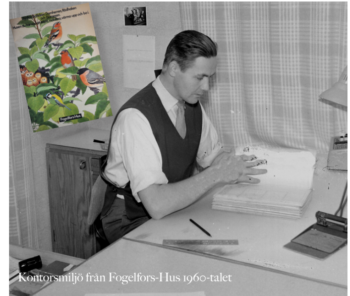
Kontorsmiljö från Fogelfors-Hus 1960-talet