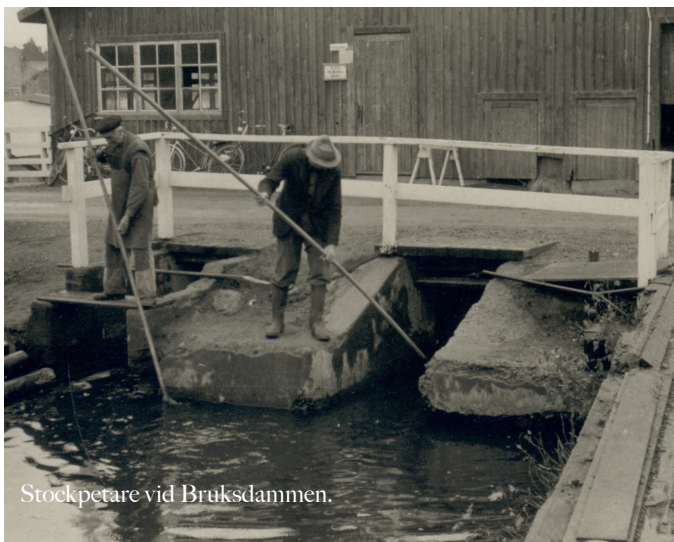
Stockpetare vid Bruksdammen.